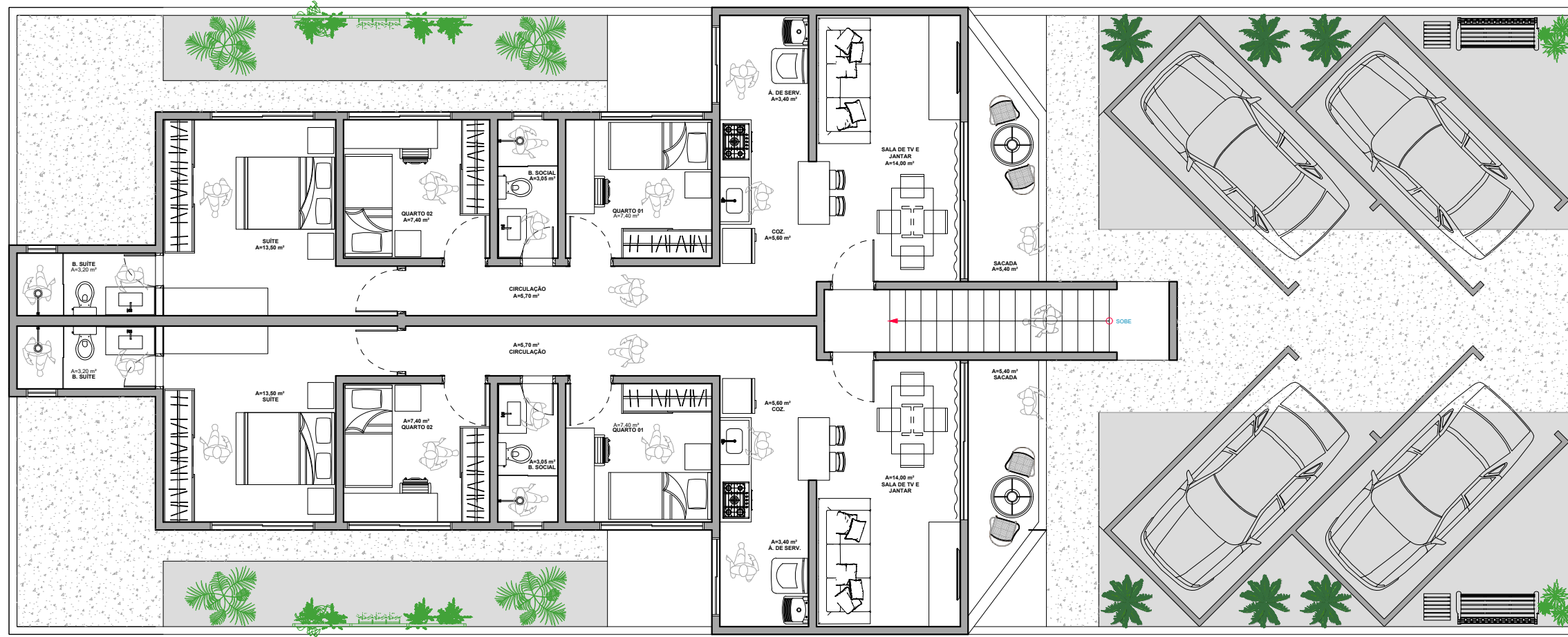
○ PLANTA BAIXA - SUPERIOR